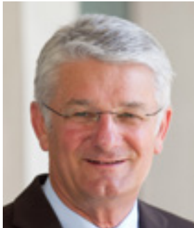
Theo Zellner Präsident des Bayerischen Roten Kreuzes

Wir hoffen, dass diese Broschüre geflüchteten Menschen, die traumatisiert sind, Unterstützung und Hilfe bietet.